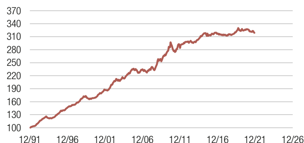
Wertentwicklung seit Dezember 1991 in Euro (indexiert)

Bitte beachten Sie den Warnhinweis am Ende der Seite.