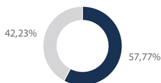
Die 10 größten Positionen in Prozent vom Gesamtportfolio

Die Top 10 Holdings werden in Prozent des Gesamtnettovermögens angegeben. Die Zusammensetzung des Fonds kann sich jederzeit ändern. Hinweise auf bestimmte Wertpapiere sollten nicht als Empfehlung zum Kauf oder Verkauf oder als Aussage über deren Gewinnpotenzial verstanden werden.