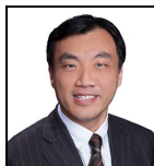
Christopher Lo Seit Nov 25

Verwaltungsgesellschaft: Threadneedle Man. Lux. S.A. Umbrella-Fonds: Columbia Threadneedle (Irl) ICAV SFDR-Kategorie: Artikel 8 Auflegungsdatum des Fonds: 06.11.25 Index: Russell 1000 - Net Return Vergleichsgruppe: Morningstar Category US Large-Cap Blend Equity Fondswährung: USD Fondsdomizil: Irland Ex-Dividendendatum: Annual Zahlungsdatum: Annual Fondsvolumen: $53,0m Anzahl der Wertpapiere: 349 Preis der Anteilsklasse: 10,8265 Marktpreis: 10,8500 Marktpreis bezogen von der Deutschen Börse. Alle Angaben in USD