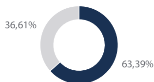
Die 10 größten Positionen in Prozent vom Gesamtportfolio