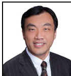
Christopher Lo Seit Nov 25

Verwaltungsgesellschaft: Threadneedle Man. Lux. S.A. Umbrella-Fonds: Columbia Threadneedle (Irl) ICAV SFDR-Kategorie: Artikel 8 Auflegungsdatum des Fonds: 06.11.25