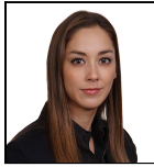
Tiffany Wade Seit Sept 24

Verwaltungsgesellschaft: Threadneedle Man. Lux. S.A. Umbrella-Fonds: Columbia Threadneedle (Lux) I SFDR-Kategorie: Artikel 8 Auflegungsdatum des Fonds: 28.07.00 Index: S&P 500 Index Vergleichsgruppe: Morningstar Category US Large-Cap Blend Equity Fondswährung: USD Fondsdomizil: Luxemburg Fondsvolumen: €311,9m Anzahl der Wertpapiere: 39 Preis der Anteilsklasse: 42,6500 Alle Angaben in EUR